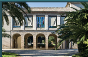
Ingresso Villa Baruchello