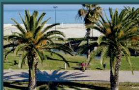
Lungomare di Porto Sant'Elpidio